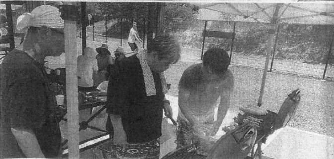
保養施設の外観（上）とバーベキューを楽しむ社員たち