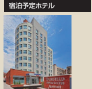
宿泊予定ホテル FAIRFIELD INN & SUITES BY MARRIOTT BROOKLYN 181 3rd Ave. Brooklyn, NY 11217 Tel: 718-522-4000

★その他：商業界リテールマネジメントスクール・常任講師、商業界アメリカ小売業視察セミナー・常任講師、商業界チラシ・DM大賞審査委員